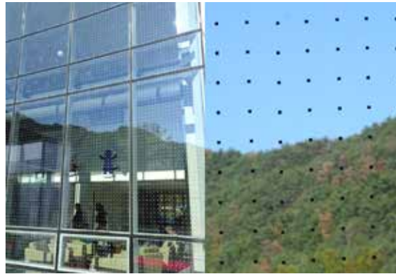
도트형 방지 스티커 부착

국민의 관심과 일상 속 작은 실천으로 새들의 죽음을 줄일 수 있습니다. 새들이 유리창으로 비행하지 않도록 5x10 규칙과 예방법을 실천해주시기 바랍니다. 주변에서 새들의 유리창 충돌을 발견했다면, 페이스북 <야생조류 유리창 충돌> 과 네이처링(www.naturing.net) 에 공유해주세요.