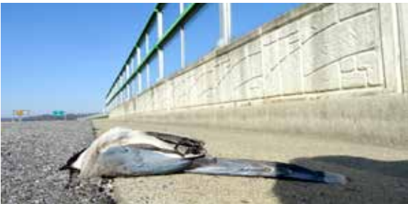
투명 방음벽에 부딪힌 사례

새들은 좋은 시력과 비행능력을 갖추고 있음에도 왜 유리창을 피하지 못할까요? 유리의 투명성과 반사성으로 인해 새들은 유리창을 개방된 공간으로 착각합니다. 따라서 비행하던 속도를 줄이지 않아 유리창과 충돌하게 되고, 치명적인 부상을 당해 대부분 폐사에 이릅니다.