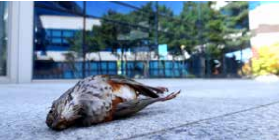
건물 유리창에 부딪힌 사례

건물과 투명방음벽 아래를 보면 유리창에 충돌해 폐사한 새들의 사체를 주변에서 흔하게 볼 수 있습니다. 우리나라는 2018년 조사결과 약 8백만 마리로 하루 2만 마리의 새들이 덧없이 죽고 있습니다.