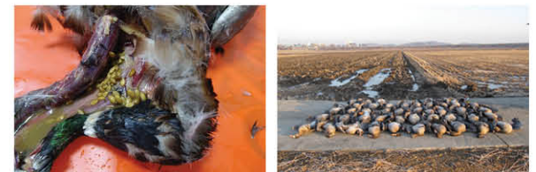
(폐사체 부검 시 식도에서 검출된 벌씨) (기러기 및 오리류(청둥오리) 집단폐사)